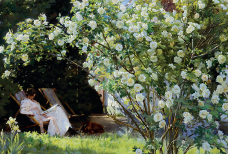
PEDER SEVERIN KROYER, SKAGENS KUNSTMUSEUM